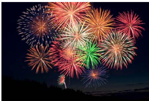
Огномет за 11 Октомври