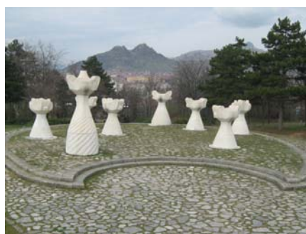
Парк на револуцијата-Могила