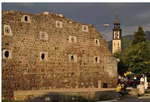
Центар на Прилеп